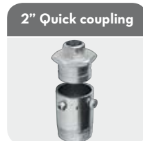
2" Quick coupling