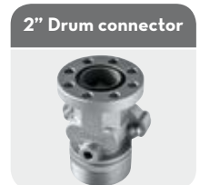
2" Drum connector