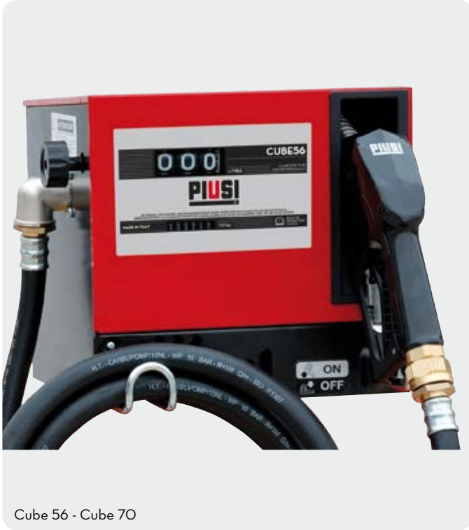
Cube 56 - Cube 70