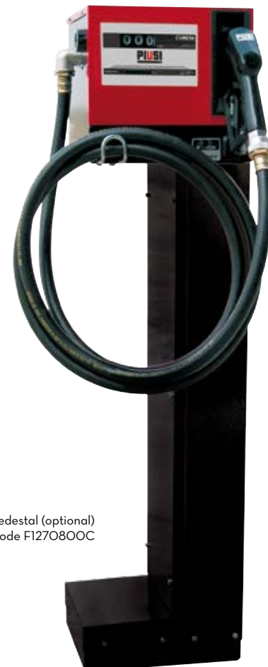
Pedestal (optional) Code F1270800C