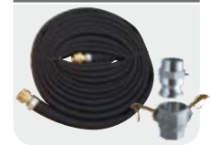
Hose Kit 1" 1/2

Code: F18798000 (delivery hose 10 mt + Camlock) Code: F18799000 (delivery hose 20 mt + Camlock)