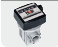
Meter K700 M

Flow rate: 20 - 220 l/min Accuracy: +/- 1% Oval gear system Code: F00540000