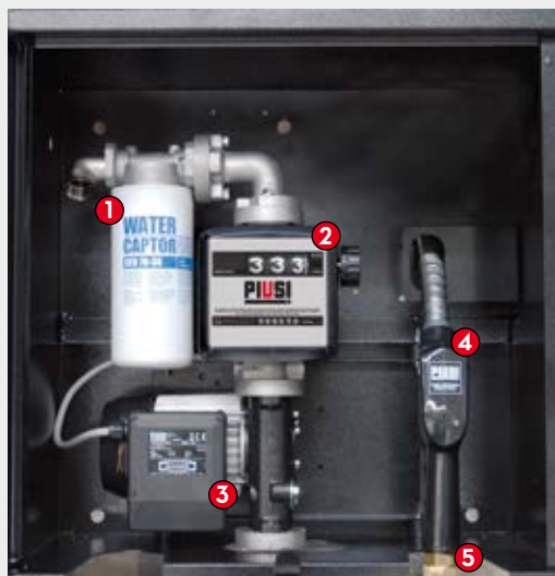
ST BOX Basic