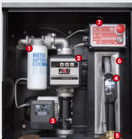
ST BOX Pro