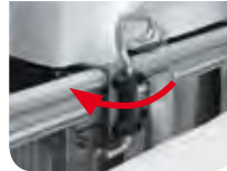
New Safety lock bracket system