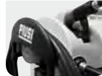
Large & Robust Hose Holder