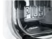
Sturdy Stainless Steel Plate