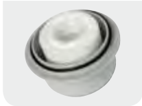
AdBlue® long life 3D Filter