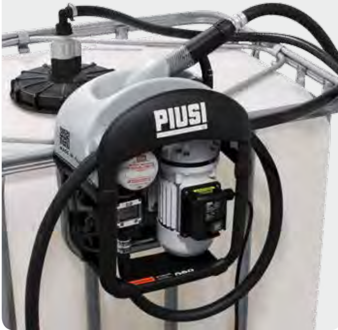
PIUSI THREE25 with SEC, K24 and SB325